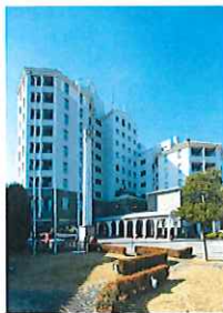
長崎インターナショナルII