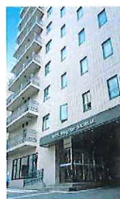
H ウィング・ポート長崎