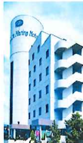
大村マリーナホテル