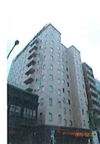
H ベルビュー長崎出島